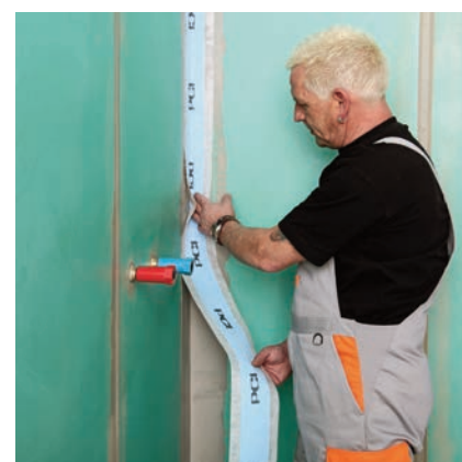
Těsnicí páska PCI Pectitape ® se vtlačí do čerstvé vrstvy izolačního materiálu a materiál se okraje přetřou.