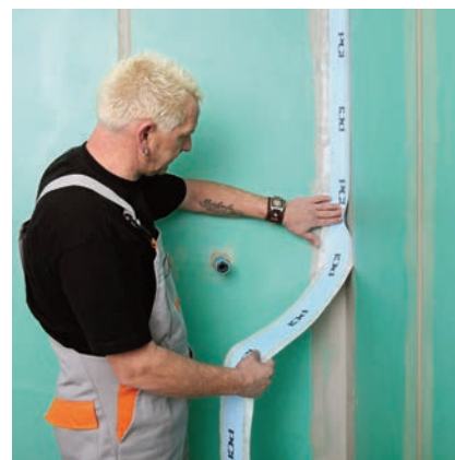
Následně umístit těsnicí pásku PCI Pecitape® 120 nebo PCI Pecitape® Objekt a zlehka přitlačit ...