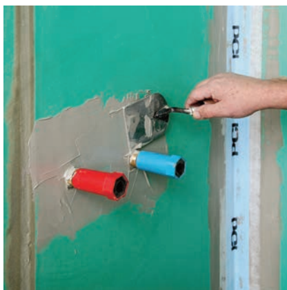
Také při utěsnění vodovodního potrubí těsnicí manžetou PCI Pecitape® 10x10 je potřeba nejdříve nanést dostatečné množství hydroizolačního materiálu.