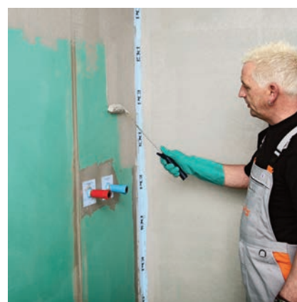
Po realizaci detailů následuje celoplošná hydroizolace.