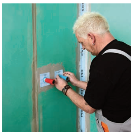
... těsnicí manžetu opatrně natáhnout přes stavební zátku na distanční prvek a usadit do čerstvé hydroizolace.