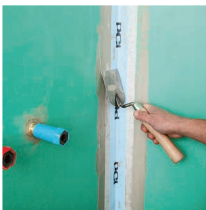
... a následně mírným tlakem zatlačit.